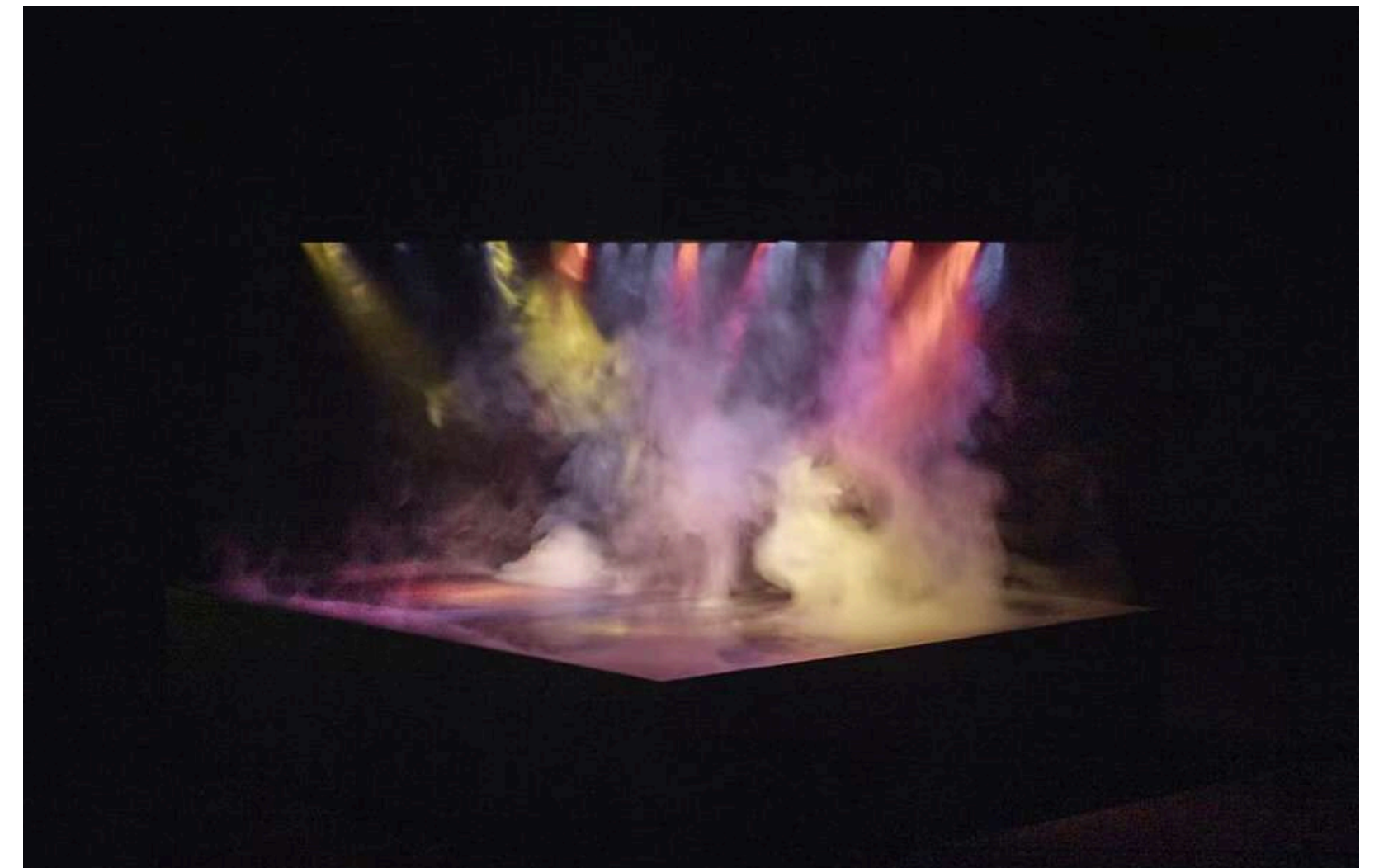
Pierre Huygue, L'expédition scintillante

La hauteur des perches, d'environ 6 mètres, pourra être ajustée en fonction des lieux et de la configuration du plateau.