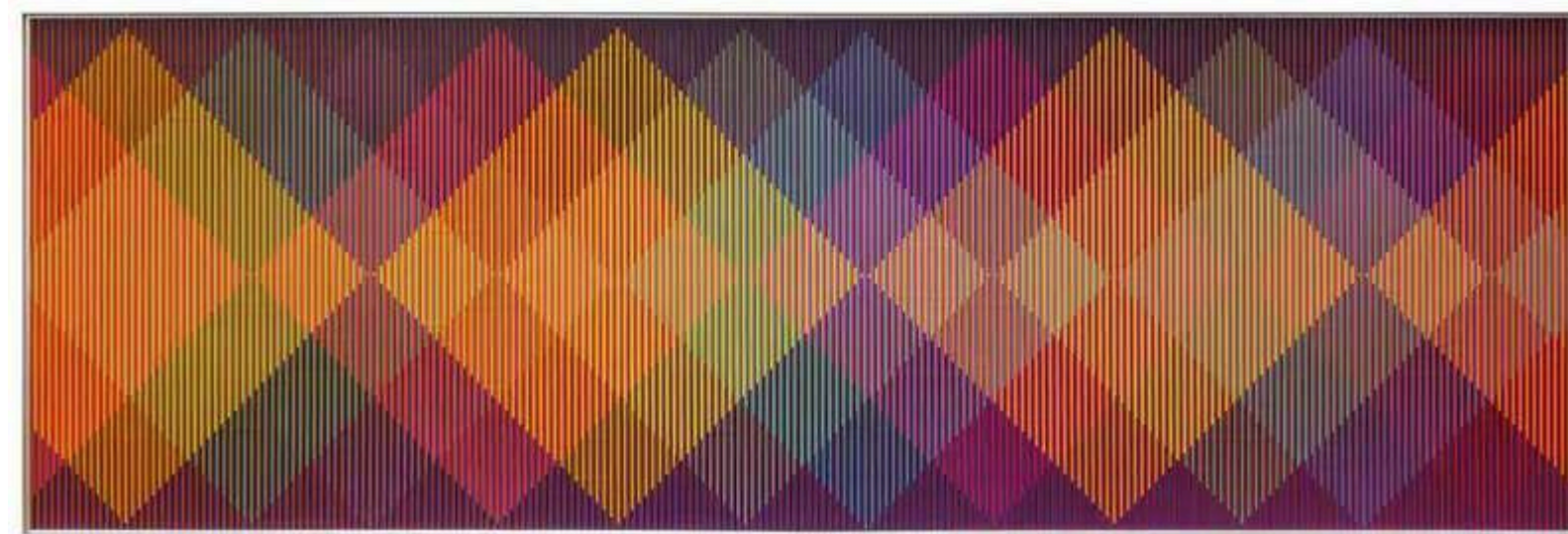
Carlos Cruz Diez, Physichromie Panam 223