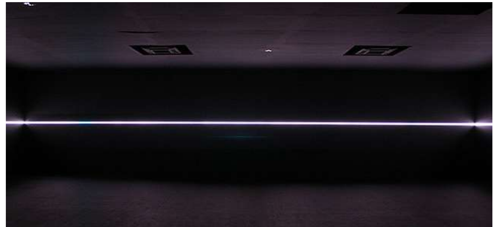
Olafure Eliasson, Contact